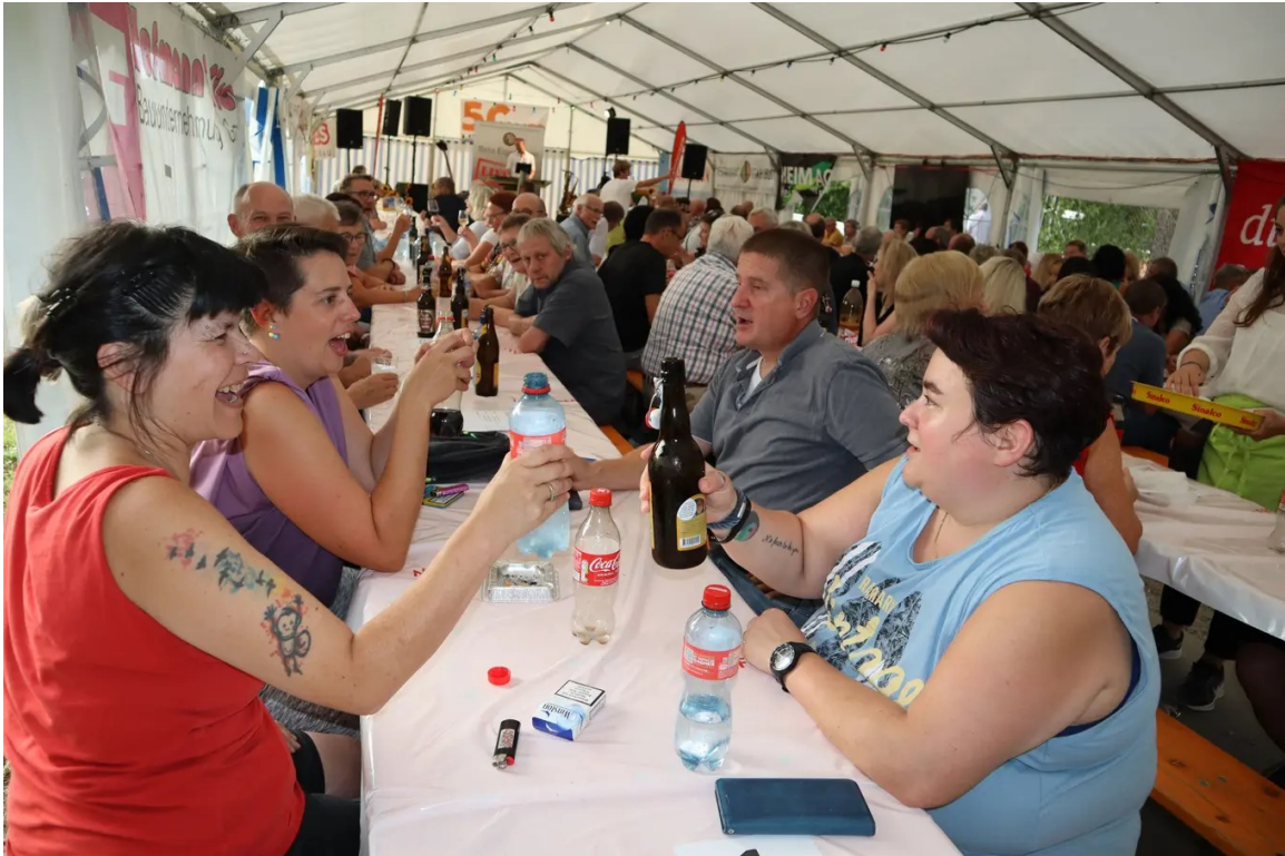
Jubiläumsparty im Festzelt.